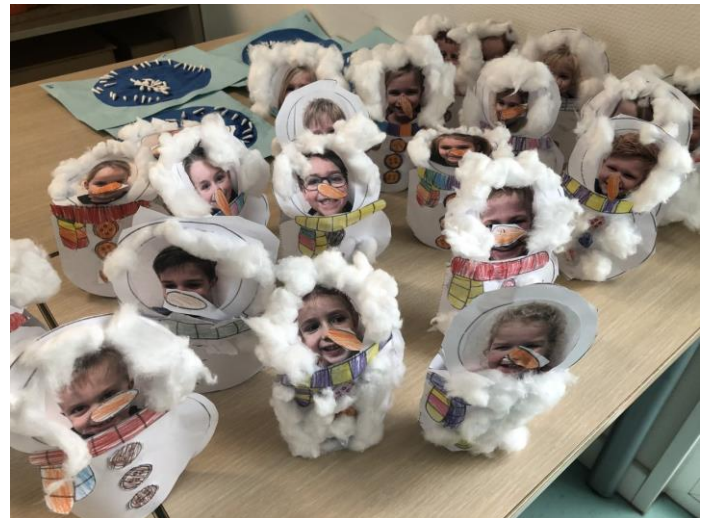
Creativiteit in de Goudvisgroep

Communicatie met kinderen die thuiszitten kan na 14.15 uur plaatsvinden. Zit een kind langer dan 3 dagen thuis, dan wordt er een laptop meegegeven aan een kind die in de buurt woont om deze af te geven of de ouders van het zieke kind wordt gevraagd deze op te halen op school. Thuis kan er dan gewerkt worden aan oefeningen voor rekenen, spelling en woordenschat. Deze worden door de leerkracht doorgegeven. Werkboeken blijven op school. We gaan er vanuit dat de laptop weer heel en opgeladen mee terugkomt naar school, zodat deze diezelfde dag weer gebruikt kan worden.