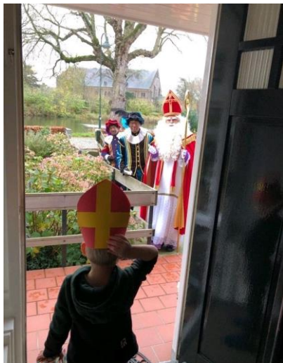
Alle zieken werden thuis bezocht.