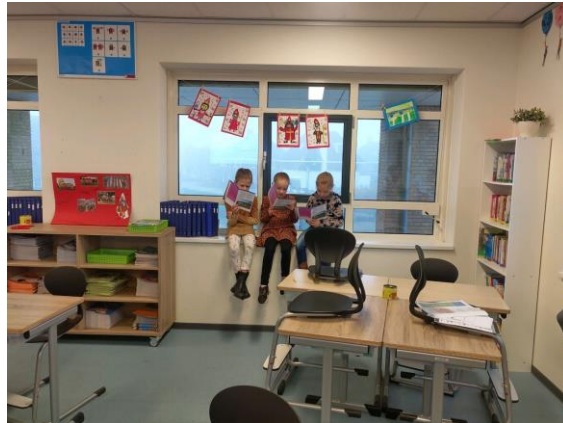
Lezen in drietallen in groep 5